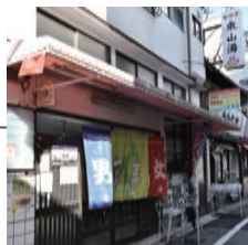
東山湯温泉 ひがしままゆおんせん