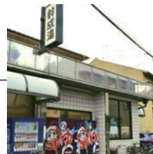
鈴成湯 すずなりゆ