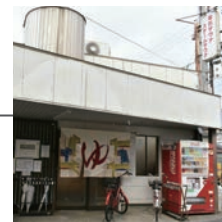
大黒湯 だいくろゆ

京都市左京区吉田下大路町22 15:00~25:00 (現在、24:00まで時短営業中) 木曜日定休 075-771-1146