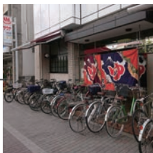
しののめ湯 しののめゆ