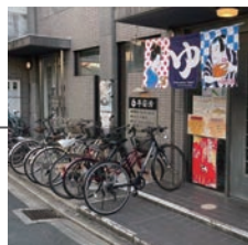
平安湯 へいあんゆ